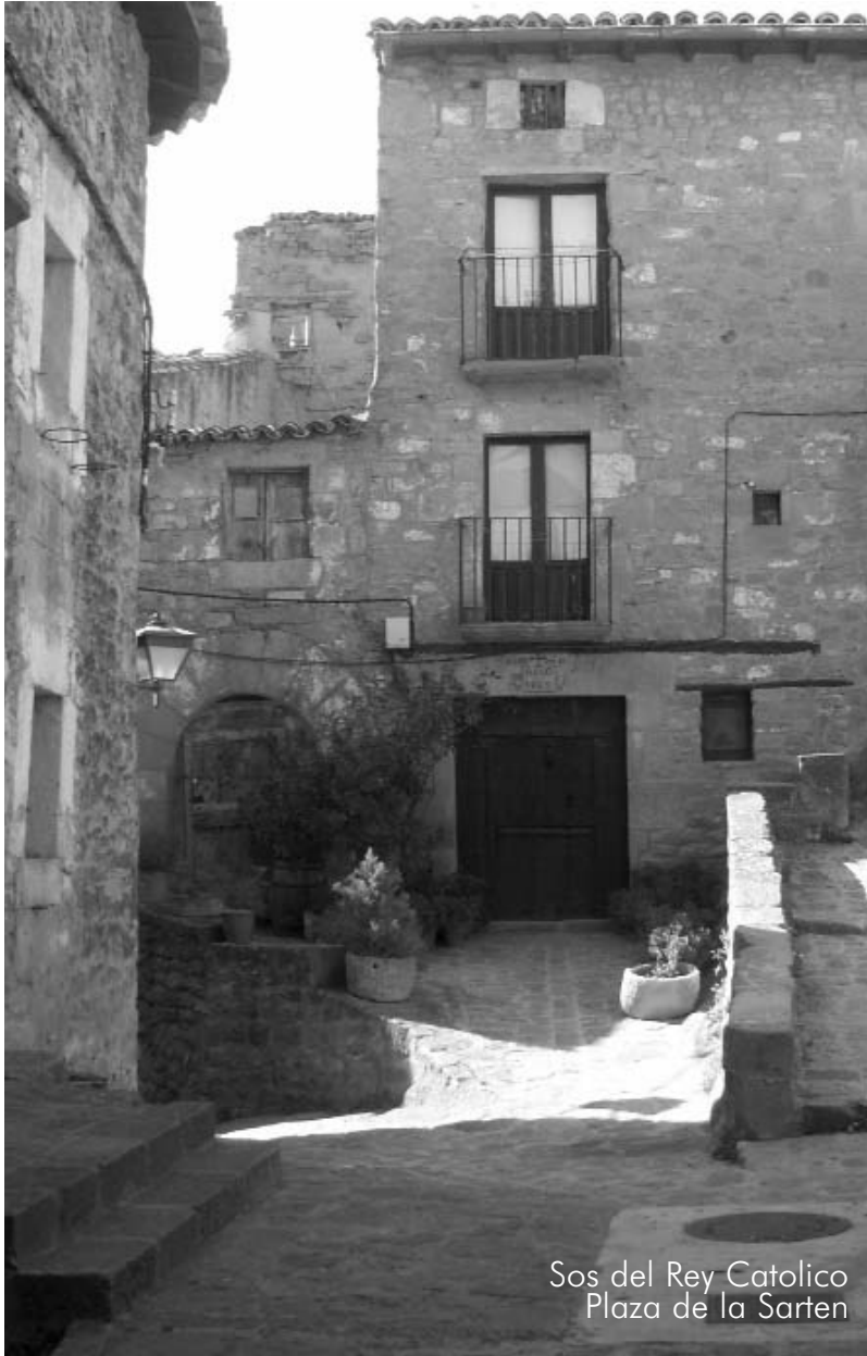
Sos del Rey Catolico Plaza de la Sarten