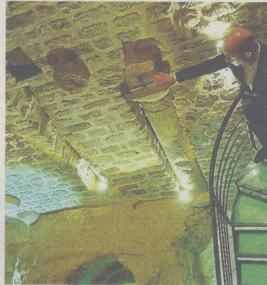
◆ COLUMNAS Conservadas in situ y sin transformaciones. FUNDACIÓN UNCASTILLO

GARCÍA: «LOS RESTOS SE MANTIENEN EN SU LUGAR ORIGINAL, SIN MODIFICARLOS NI MOVERLOS»