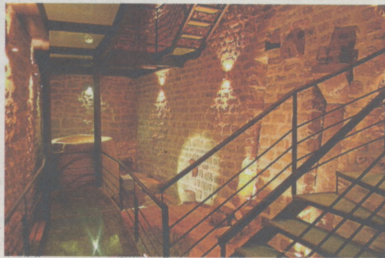
◆ ILUMINACIÓN Cuidada al detalle para no interferir en la contemplación. FUNDACIÓN UNCASTILLO

Además, para poder visitar los restos de forma cómoda, sin afectar la estructura ni los elementos originales, se ha colocado una estructura metálica y de vidrio. «La iluminación se ha cuidado al detalle, para no interferir en la contemplación, ayudando a una mejor comprensión de la trascendencia del lugar que se visita. Finalmente, también se han incluido dos paneles con información básica sobre las juderías medievales y las sinagogas», explica el director. Lo único que falta es la colocación de una vitrina con los objetos encontrados más interesantes. Entre ellos, la cerámica con la estrella de David.