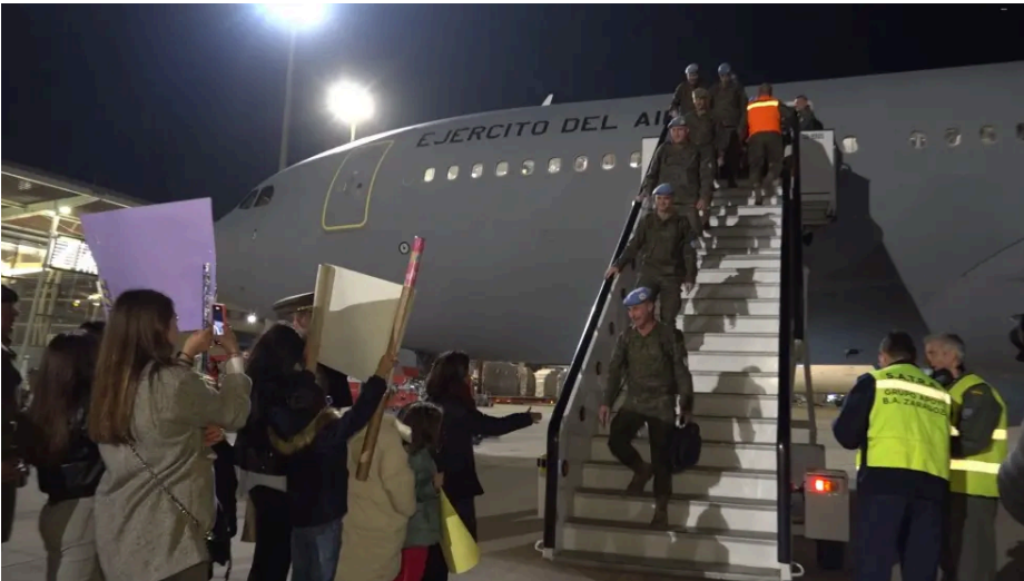
Llegada de la brigada 'Aragón' de El Líbano.

Los matices de parte de Israel es que se trata de ciudadanos que quieren salir de Gaza por voluntad propia y de países que quieren recibir ciudadanos de voluntad propia. Es muy importante decirlo. Desde mi perspectiva, el presidente de Estados Unidos está intentando abordar el conflicto de otra forma. Tal vez hay lugares para nuevas ideas sobre el futuro para poder alcanzar una paz duradera. Si Hamás hubiera dicho el 7 de octubre de 2023 que liberaban a los secuestrados y no representaban una amenaza para Israel, rindiendo sus armas, esa guerra podría terminar ese mismo día. Desafortunadamente, eso no fue la situación.