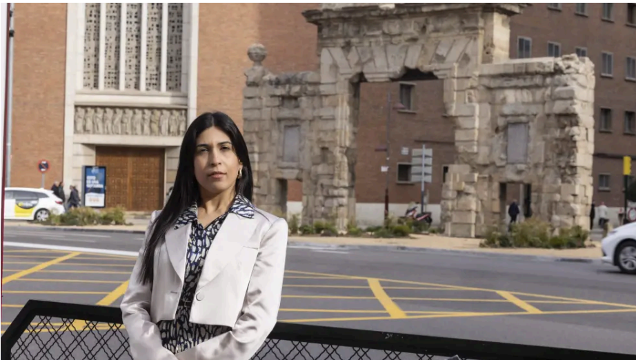
Tal Itzhakov, portavoz de la Embajada de Israel en España, en Zaragoza.

NOTICIA ACTUALIZADA 1/3/2025 A LAS 22:00