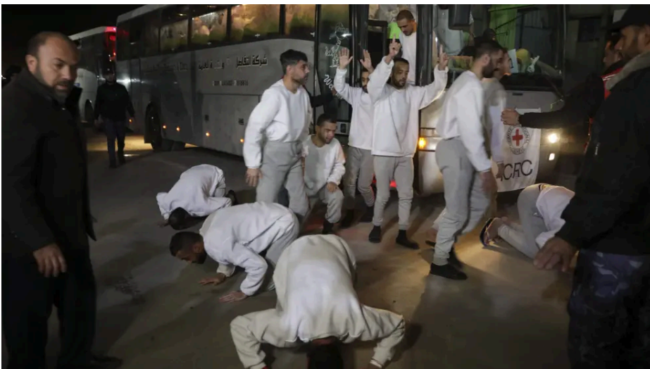
Decenas de presos palestinos liberados por Israel

El 7 de octubre de 2023, los miembros de Hamas quemaron familias enteras, violaron y secuestraron a cada persona que vieron en su camino. No importaba si era un bebé de nueve meses o una anciana de 85 años. Estamos pagando precios muy altos para poder traer a todos nuestros seres queridos a casa. Es nuestro compromiso moral. Cada israelí sabe que cualquiera de esos secuestrados podría ser su hermano, su hijo o su mamá. Es horrible sentir esa inseguridad: que en cualquier momento un terrorista puede entrar en tu casa y secuestrarte de tu cama con tu pijama. No hay una simetría entre eso y entre los terroristas que están siendo liberados, que han cometido los peores atentados en la historia de Israel.