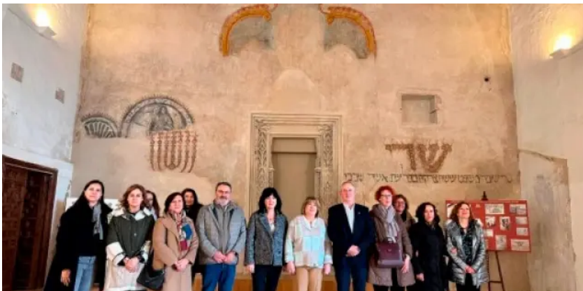
Presentación institucional de la nueva cara de la sinagoga de Híjar, a finales del pasado mes de febrero. G. A.

Asimismo, el equipo de ficción filmó en Uncastillo (Zaragoza), escenario elegido para representar los pasajes de Huesca , ciudad natal del impresor, proporcionando una visión más completa de su trayectoria y del entorno en el que vivió.