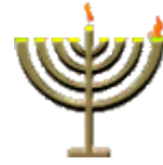
Vela del primer día

La primera noche coloque una vela en el extremo derecho de la Janukiá (candelabro). Encienda el «Shamash» (Vela piloto) y recite las bendiciones [1] , [2] y [3] .